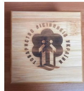
Цінний подарунок - годинник з символікою ТЛУ