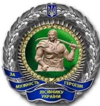
Нагрудний знак «Лісівнику України - за мужність і героїзм»