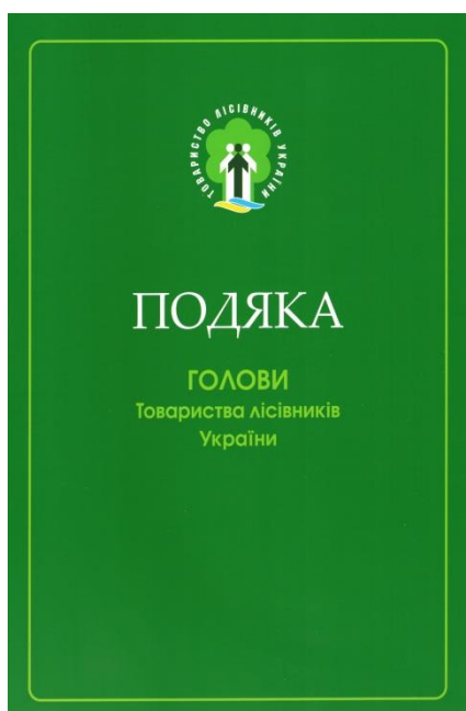
Крім того серед відзнак ТЛУ є Почесна грамота Товариства лісівників України та Подяка Голови Товариства лісівників України

Рішенням Президії Всеукраїнської ради Товариства лісівників України у 2018 – 2024 роках було нагороджено: