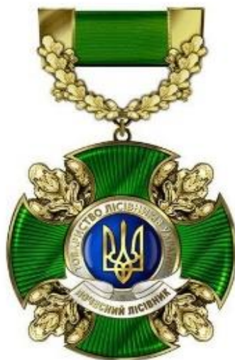
Нагрудний знак «Почесний лісівник України»